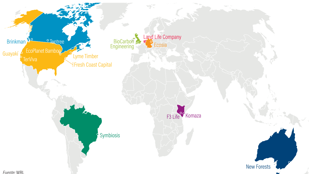
Figura ES-2 | Ubicación de la casa matriz de las empresas presentadas en este reporte

Este reporte no busca respaldar a ninguna empresa en específico. La atención de WRI y