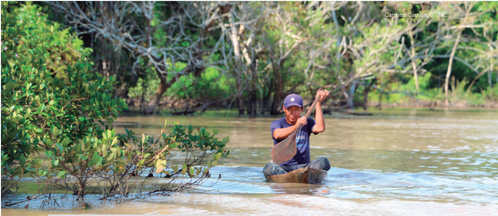
Carmen Carrion © TNC

Para la dimensión de sostenibilidad ambiental , el MEF formuló y utilizó cinco indicadores en la metodología de priorización de proyectos para el PNISC: